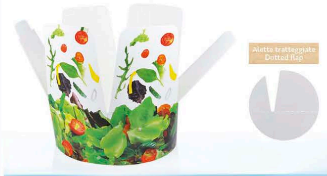
C99 ml 1.000