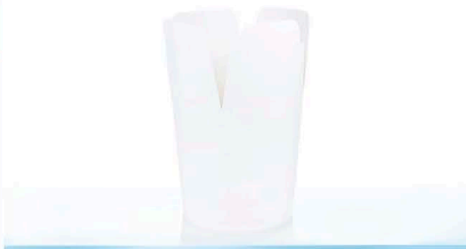
C1 ml 630