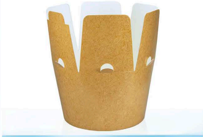
C10B ml 1.860