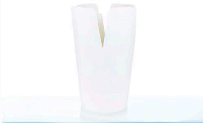
C2 ml 800