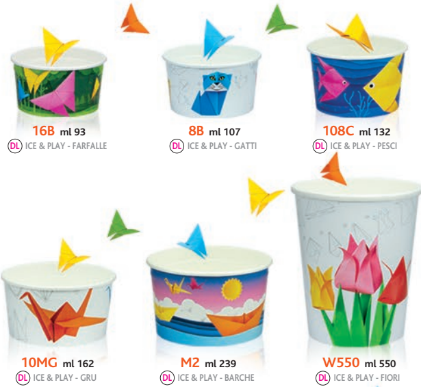
16B ml 93 DL ICE & PLAY - FARFALLE