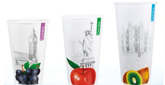
50C ml 512 CF DRINKS & CITY LONDRA