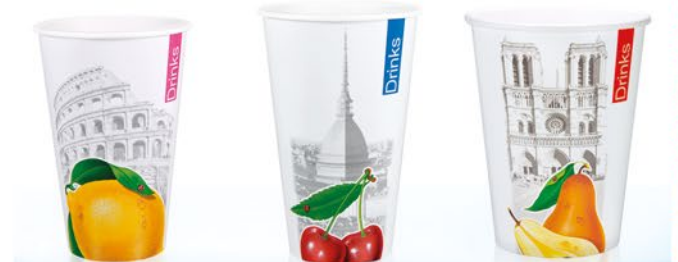
37C ml 358 CF DRINKS & CITY ROMA