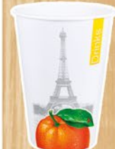
CF DRINKS & CITY