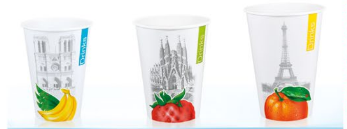
VC ml 218 CF DRINKS & CITY PARIGI