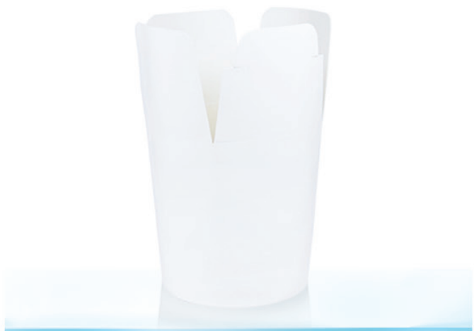
C1 ml 630