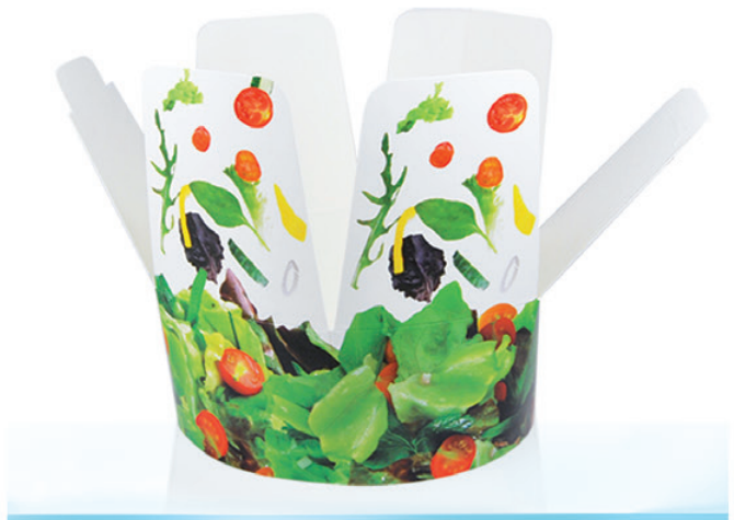
C99 ml 1.000