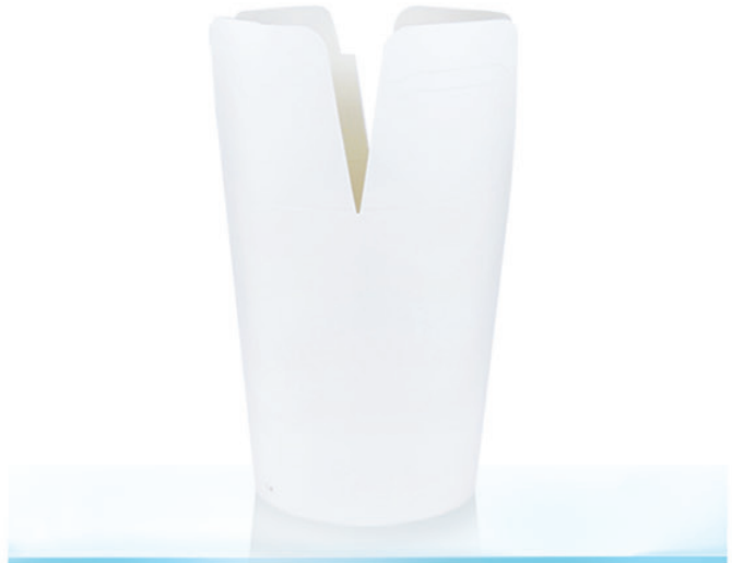
C2 ml 800