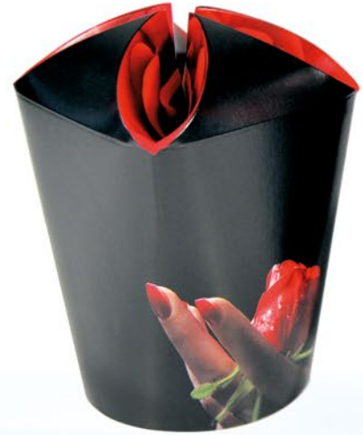
FL2 ml 200