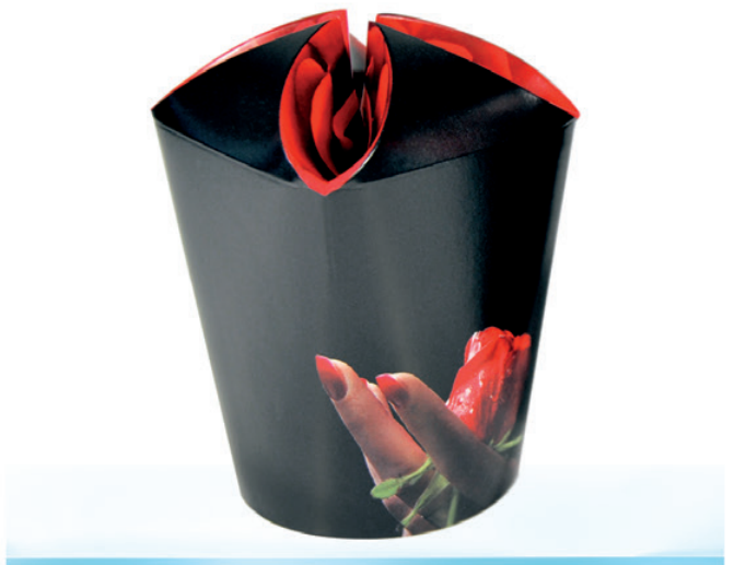
FL2 ml 200