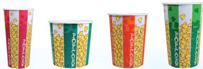
B24 ml 707 M90 ml 900 B32 ml 1.000 B45 ml 1.310