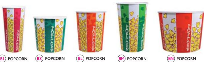
BI POPCORN BZ POPCORN BL POPCORN BM POPCORN BN POPCORN