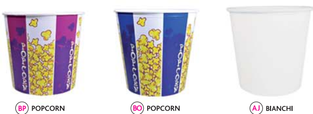
BP POPCORN BO POPCORN AJ BIANCHI