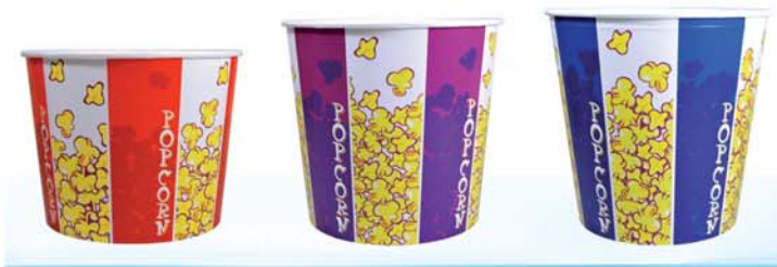
B99 ml 2.950 B130 ml 3.858 B170 ml 5.520